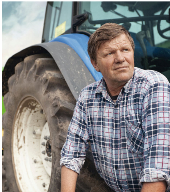
Soyez vigilants à tous les contrats de sous-traitance quels que soient leurs montants

Si vous faites appel à un prestataire établi à l'étranger, celui-ci