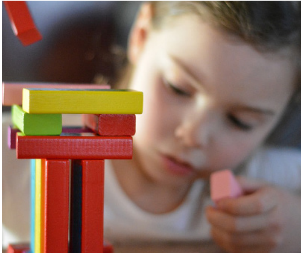
Des aides complémentaires pour le jeune enfant, les études, mais aussi pour les loisirs ou la formation BAFA.

- Les Bons Loisirs : la MSA encourage la pratique régulière d'activités sportives, artistiques ou culturelles. Elle peut financer, via les bons loisirs, les activités extra-scolaires des enfants de moins de